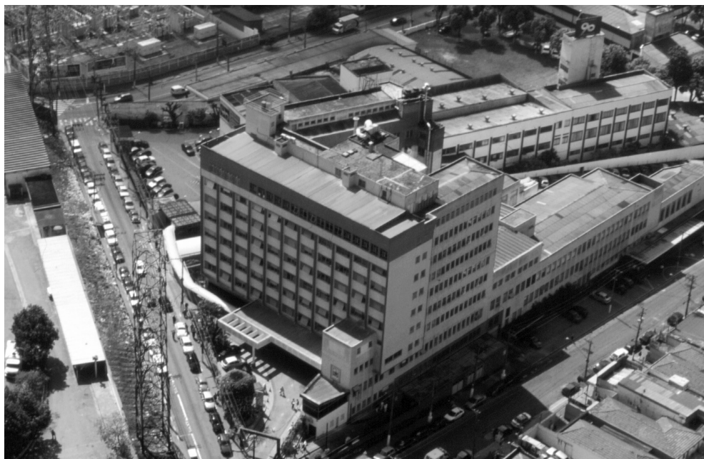
Complexo Hospitalar São Cristóvão